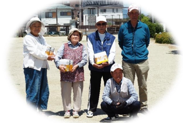
優勝チームの皆さん