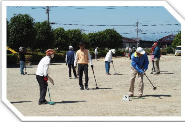
真剣プレー中の参加者

5月18日(土)、快晴の空の下、第10回長寿会グラウンドゴルフ大会が開催されました。8チーム39名の選手の皆さんが、1番から8番の各ホール同時に競技を開始。途中休憩を入れ、3ゲーム24ホールで豪華賞品を目指して腕を競いました。今回は、18人(29本)にホールインワンが出ましたが、そのたびに歓声が上がっていました。