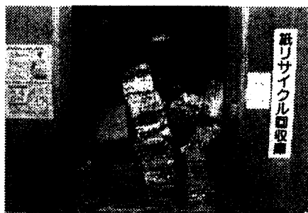
いつも乱雑状態の 回収庫内