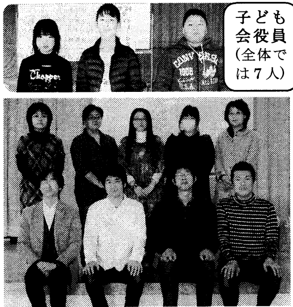
子ども会役員(全体では7人)