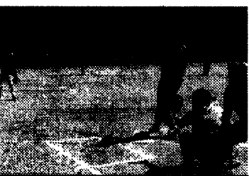
見事3ランホームラン