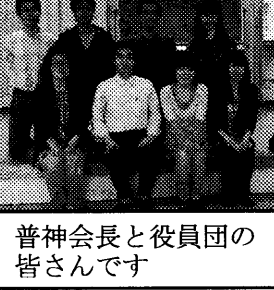
普神会長と役員団の皆様です

★ 育成会の総会が開かれました 四月七日、子ども会育成会の総会が開かれ、可愛い子供たちの声援を受けながら、旅行やクリスマス会など、今年度の計画などを話し合いました。楽しい一年になりそうですよ！