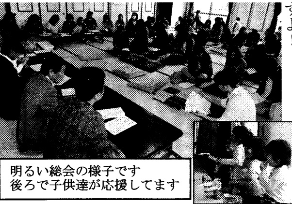
明るい総会の様子です 後ろで子供達が応援してます