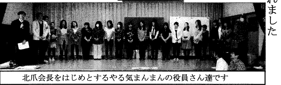
北爪会長をはじめとするやる気まんまんの役員さん達です