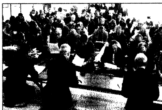
熱心な話し合いがなされた総会

続いて、新しく選出された楯会長から今年度の事業計画として予算案が提案されると、会場にはピクンとした空気が張り詰め、「よし、新たにがんばるぞ!」という参加者たちの意気込みが、会場全体に広がっていきましました。いよいよ新年度の始まりで