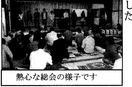
熱心な総会の様子です