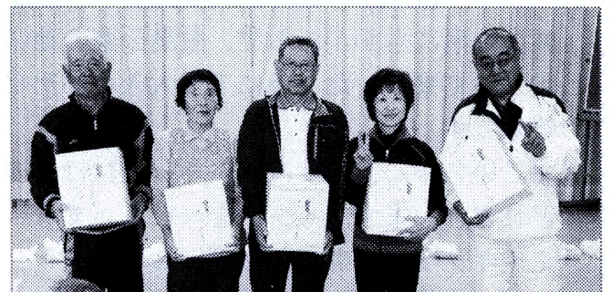
優勝したチームのみなさん