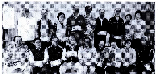
ホールインワンをした20名のみなさ

19日(土)、中央公園には、子どもからお年寄りまで、約90名の選手たちが集まり、広いグランド上を元気一杯走り回りまいた。「よ～し、入った～!」「もっといけ～!」「あら?出ちゃったよ!」などと、和気あいあいのうちに競技は進みました。この中で30mも50mも離れたホールにホールインワンをした人が20名もいました。