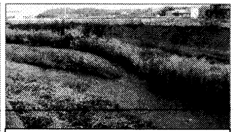
以前からの様子を伝える桃木川