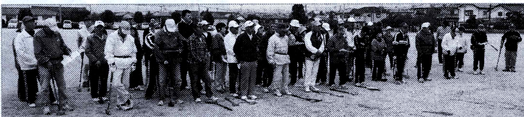
開会式に集まった、約90名の元気な選手の皆さんです