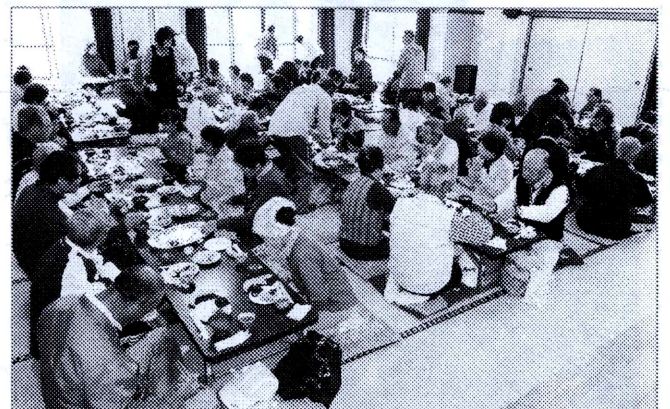
なごやかな表彰式とお昼の様子です

日頃の練習を活かした人、ビギナーズラックに小躍りした人、思いがけず賞品を手にした人、お茶やお料理を振舞ってくれた人、などなど、それぞれがそれぞれの思いで、楽しい時間を過ごすことができました。