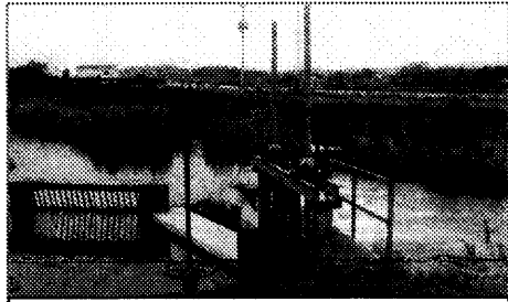
桃川小の北の延命寺川の取水口

年以前の旧利根川流路の一つ佐久発電所の放水を取り入れた広瀬川から田口町で分かれ前橋市街地北部を東へ流れ、小屋原町でふたたび広瀬川に合流する。...佐波郡新田用水、所島堰、四ヶ村堰など17の農業用水に分水している重要な灌漑用水路である。これらの流域は関根、荒牧、川端、日輪寺、北代田、竜蔵寺、青柳、下細井などである。』 さて、広瀬川と桃木川を荒牧町民ならば知らない人はいないと思うが、この両川のあいだを流れている延命寺川についてはあまり知られていない。桃川小学校の北から桃木川の水を取り入れ国道17号線を潜り「かばやそば店」の前に出る。その後町の南部の田地を潤した後、上小出町で広瀬川に合流している。この延命寺川は防火および灌漑の面から見て非常に重要な役目を果たしてきた。また子供たちが遊び、水車を回すなど生活に密着した川であった。桃川小学校でも延命寺川の水を水車で汲み上げて、足洗い場や花壇の水等にも利用していた。しかし区画整理以降は全面がボックスカルバート(暗渠)になってしまい、日頃はほとんど目につかないが、荒牧町民にとっては忘れてはならない川の一つであろう。