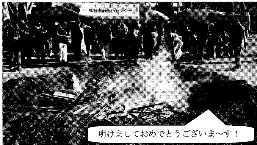
明けましておめでとうございます!

お清めをして点火をすると、ダルマや松飾りが投げ入れられ、勢いよくお焚き上げの炎が燃え上がりました。