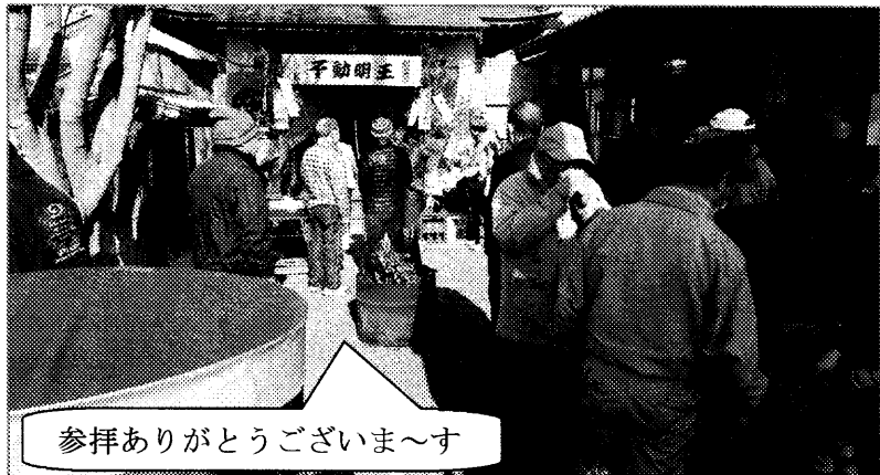
参拝ありがとうございます

お不動様は、1736年に建立されて以来、長らく火伏せの神様として信仰されて参りました。明治22年荒牧の村に発生した大火がお不動様の所まで来ると、不思議なことに火勢が急に衰え、延焼をまぬがれた事があり、以来、厚く信仰されてきました。