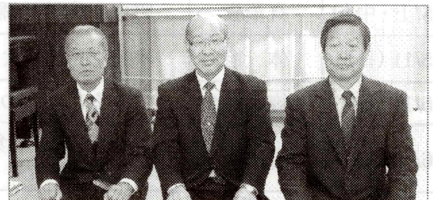
(左から、高橋副会長、関口会長、楯副会長)