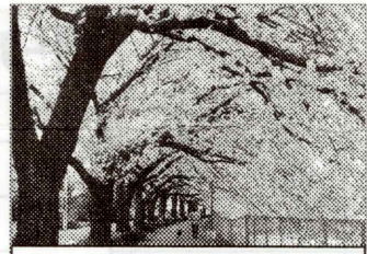
桃木川沿いの桜トンネル