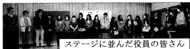
ステージに並んだ役員の皆様

新年度の計画では、毎月1つ以上の事業が予定されていて、充実した1年になることが予想されます。あちこちで子どもたちの元気な笑顔があふれることでしょう。