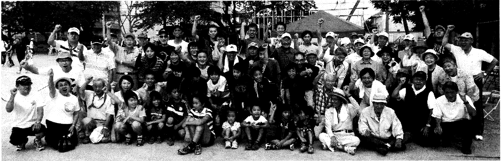
団地チーム、優勝おめでとう！ほかのチーム同様に一人一人の頑張りとお応援の励ましに拍手！！