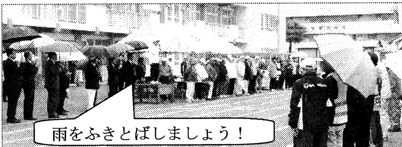
雨をふきとばしましょう！