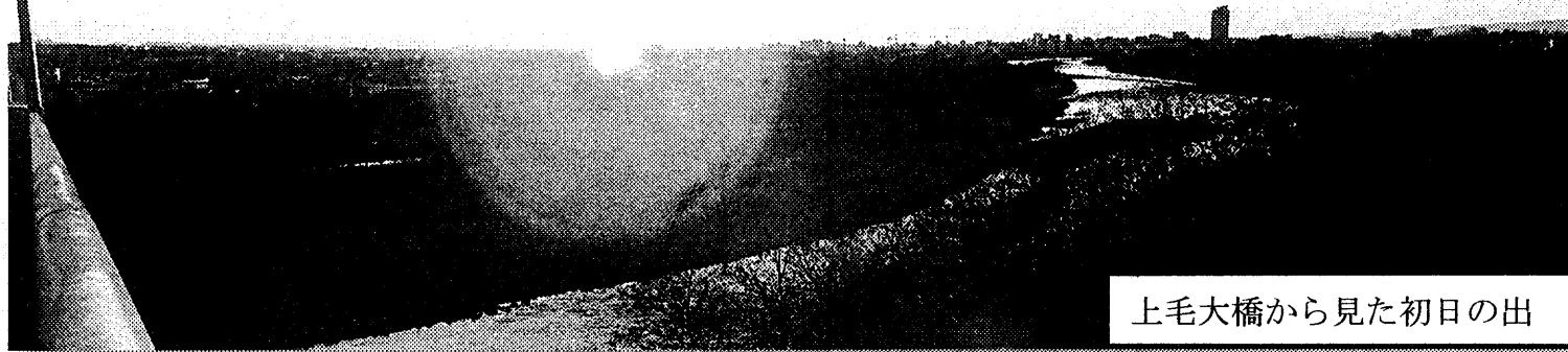
上毛大橋から見た初日の出