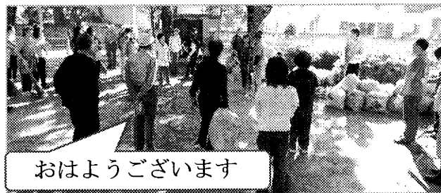
おはようございます