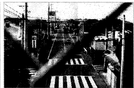
角屋酒店(道の左側)

次に大正時代に開店した角屋酒店は、17号線から桃川小学校に入る丁度角にあった。しかしこの店も平成7年に閉店となり、以前からの荒牧町では一軒も酒店は見られなくなってしまった。