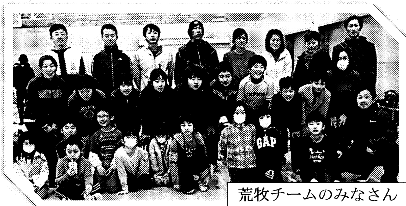
荒牧チームのみなさん