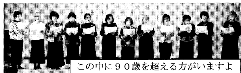
この中に90歳を超える方がいますよ