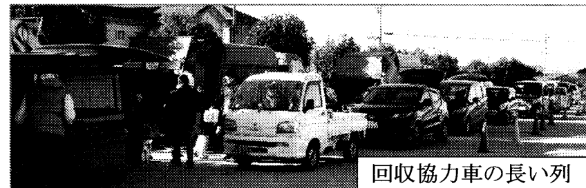
回収協力車の長い列