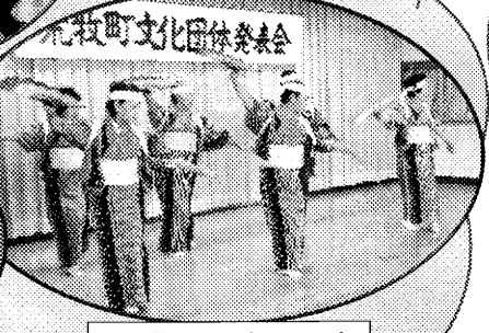
荒牧町民謡クラブ