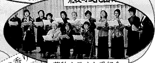
荒牧カラオケ愛好会