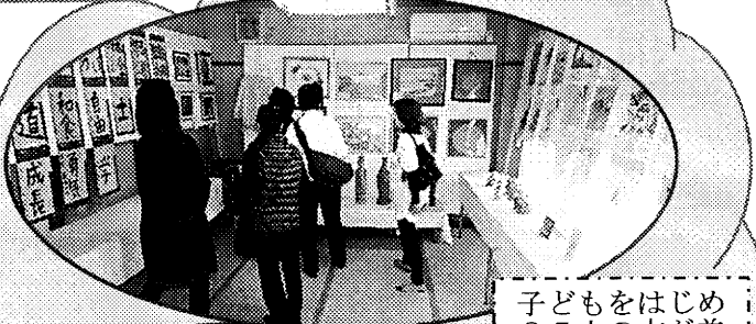
子どもをはじめ 85人の方が美術 作品をだしてくれました