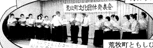
荒牧町ともしびコーラス