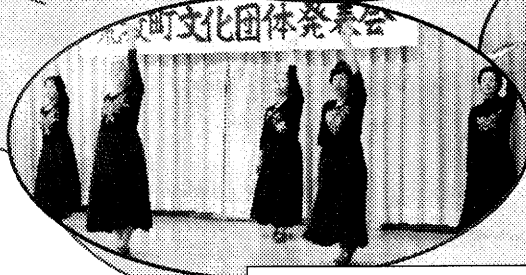
チェリーポルカ荒牧