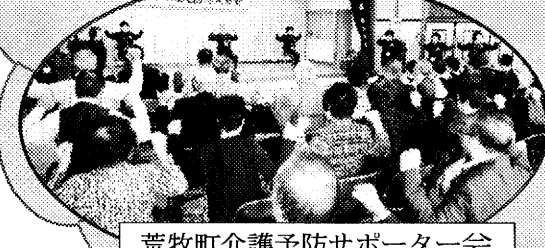
荒牧町介護予防サポーター会