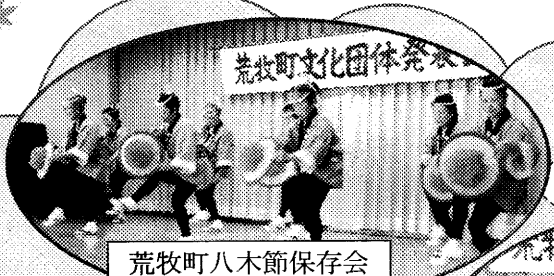
荒牧町八木節保存会