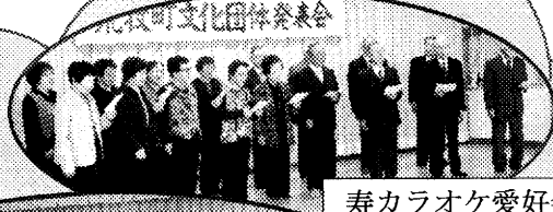
寿カラオケ愛好会