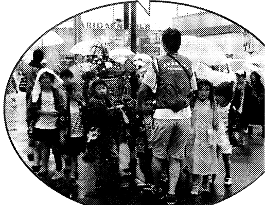
元気な子どもみこし