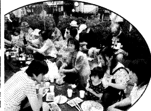
にぎわうテントの中