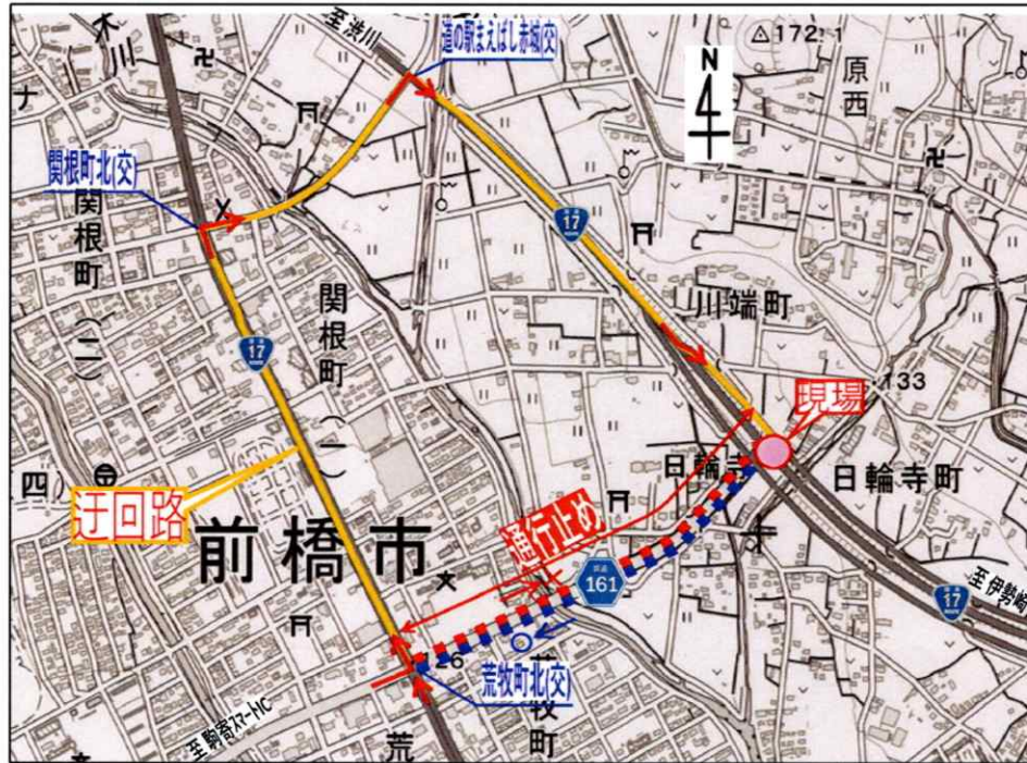
国土地理院ウェブサイト地図データをもとに東網橋梁勢が作成しています